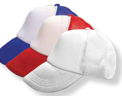
כובע מצחייה חצי רשת