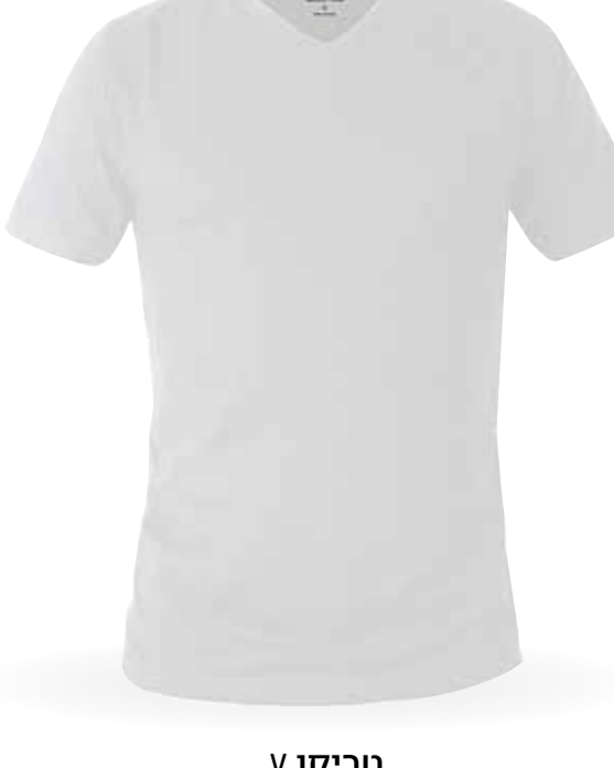
∨ טריקו 100% כותנה שחור/לבן