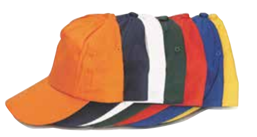
כובעי מצחייה במבחר צבעים