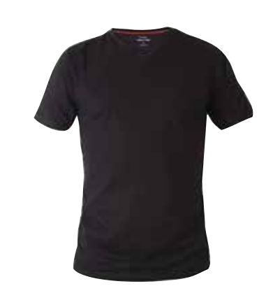
לייקרה נשים 95% כותנה + %5 טפנדקט